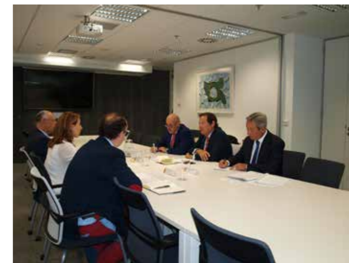
Reunión con Ministra Industria, Comercio y Turismo.