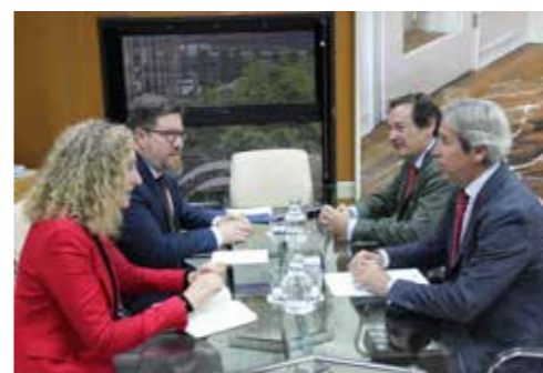
Reunión Consejero Agricultura.