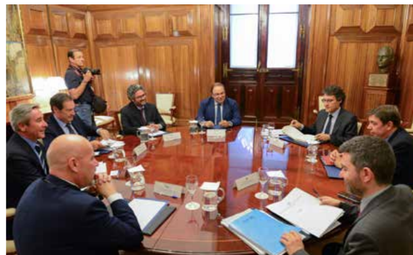
Reunión con Ministro de Agricultura.