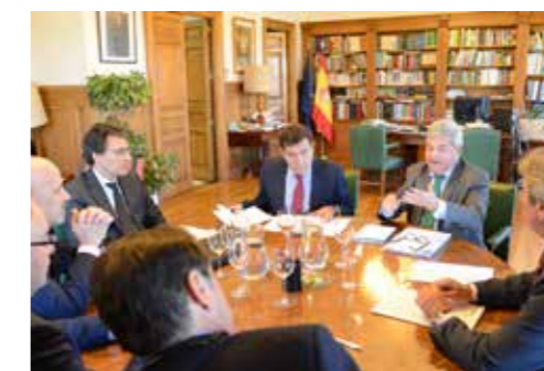
Reunión con Secretario General de Agricultura y Alimentación.