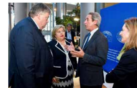
Reunión Parlamento Europeo.